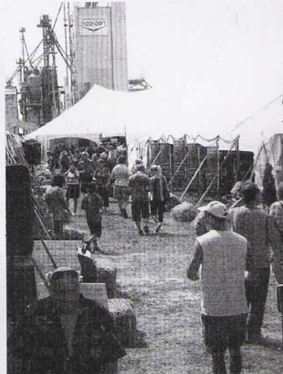
Ce sont plus de 75 artisans alimentaires qui présentent leurs produits, c'est 25 de plus que l'année dernière.