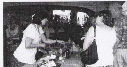
La région du Bas-St-Laurent proposait pas moins de 28 produits différents aux visiteurs.