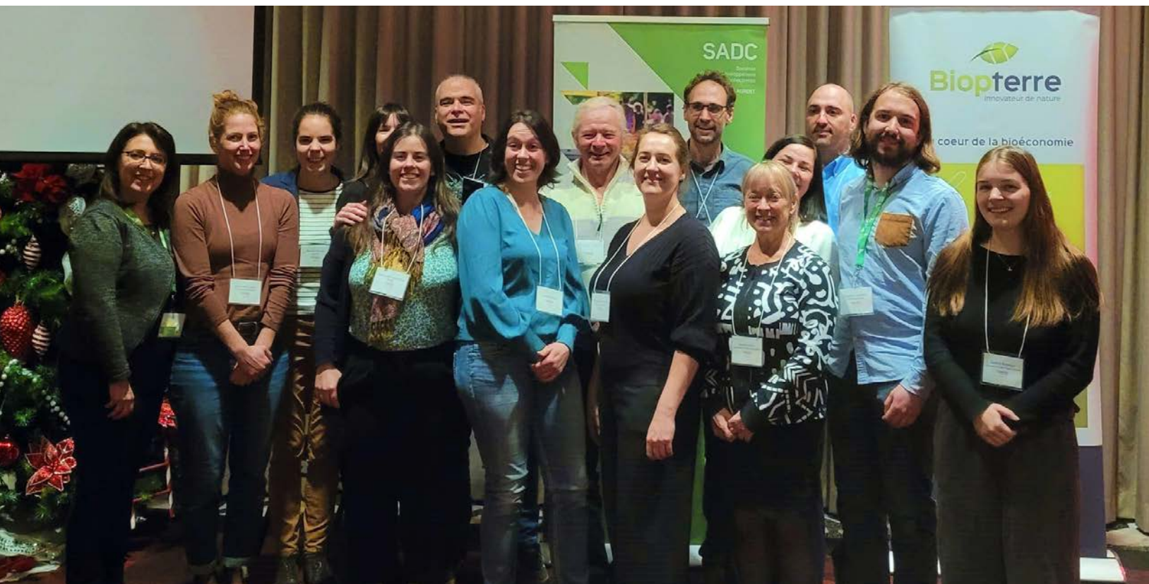
Photo : Membres du Comité Filières produits forestiers non ligneux et cultures innovantes du Bas-Saint-Laurent

Le colloque a marqué une étape clé pour le développement de la filière, posant les bases d'initiatives structurantes et ouvrant la voie à de nouvelles opportunités sur les marchés régional et national. Son succès repose sur l'engagement des partenaires qui ont contribué à faire de cet événement un moment déterminant pour l'avenir de la noisette au Québec, positionnant les producteurs de noisettes du Bas-Saint-Laurent comme une référence d'une filière prospère.