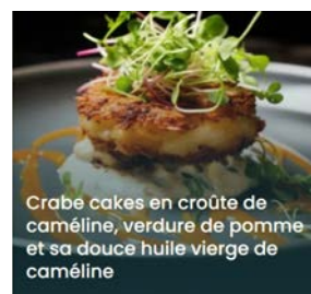
Crabe cakes en croûte de caméline, verdure de pomme et sa douce huile vierge de caméline