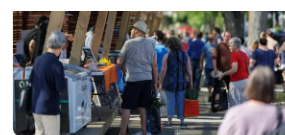
S' imprégner de l'été grâce aux marchés publics